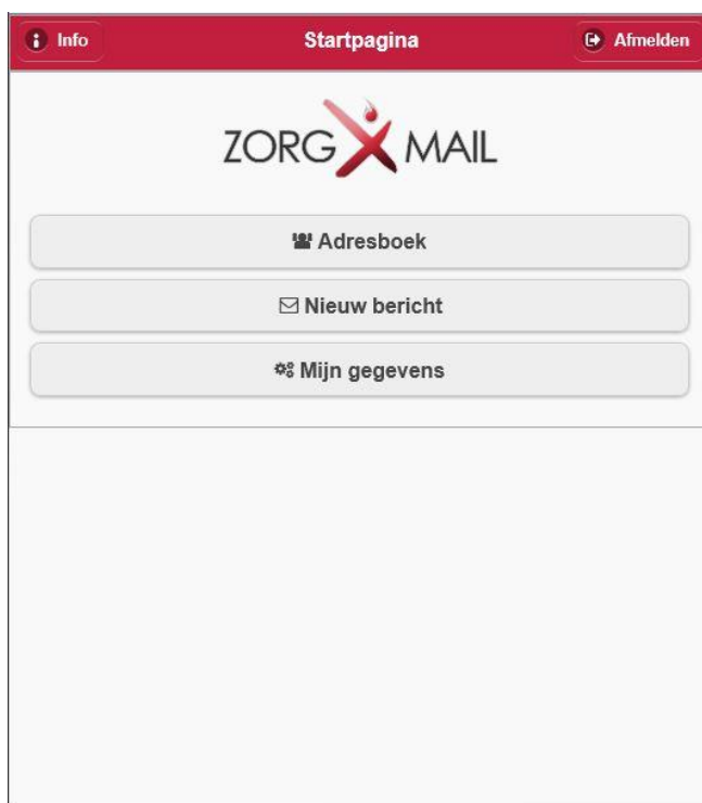
Figuur 3 Startpagina - Opties